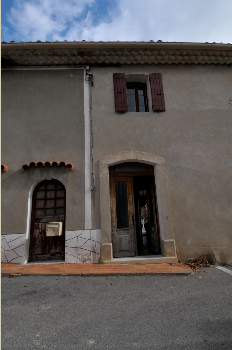
Entrée par la rue