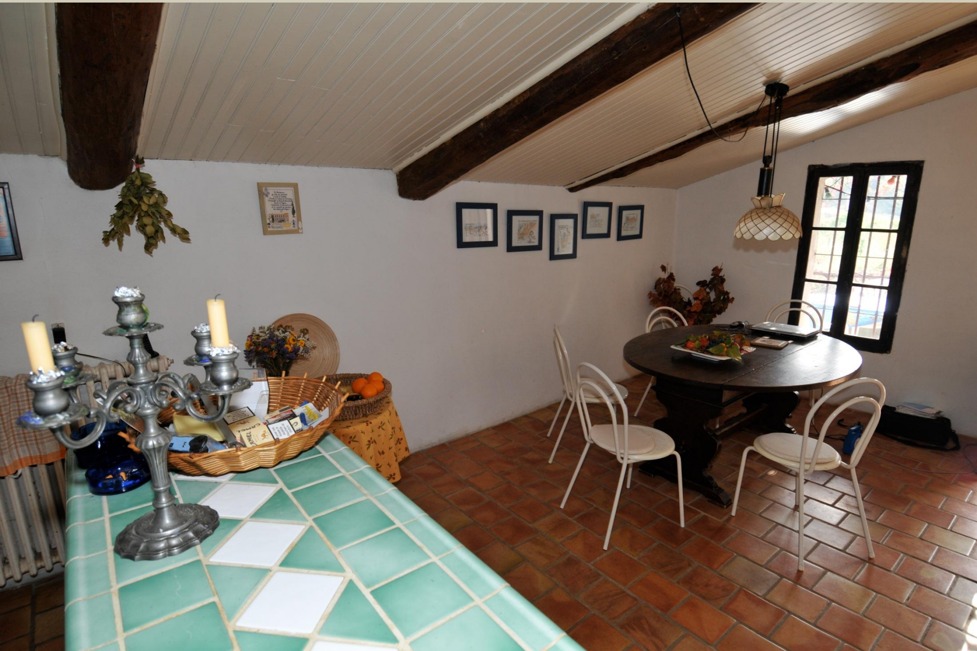
3. Salle à manger