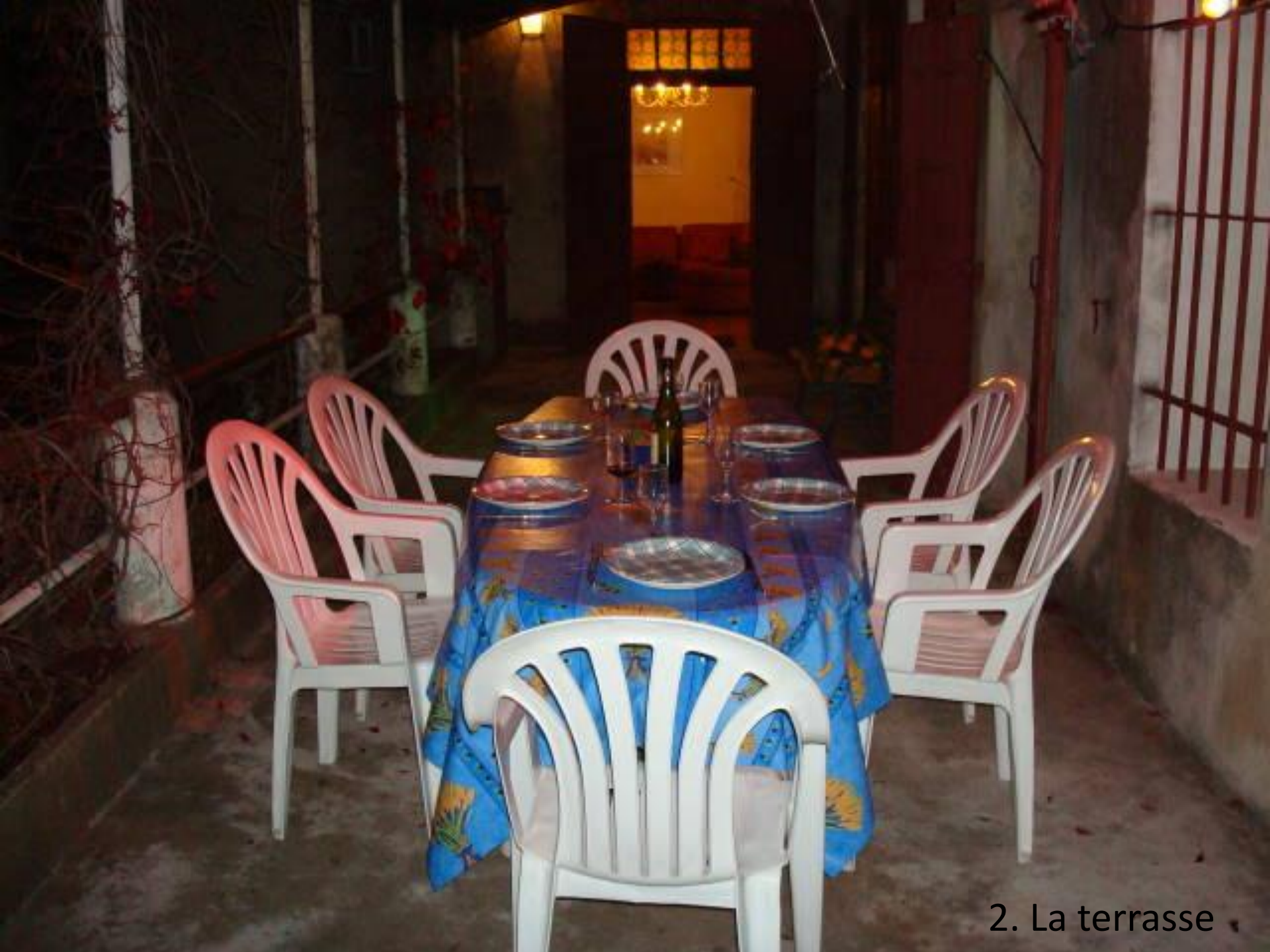
2. La terrasse