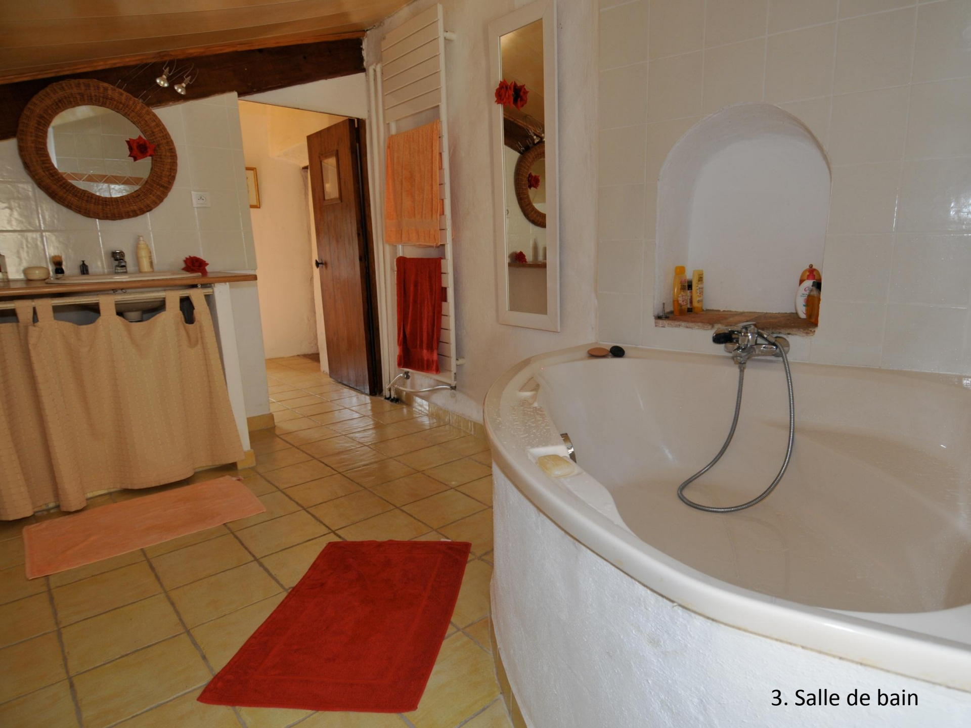
3. Salle de bain